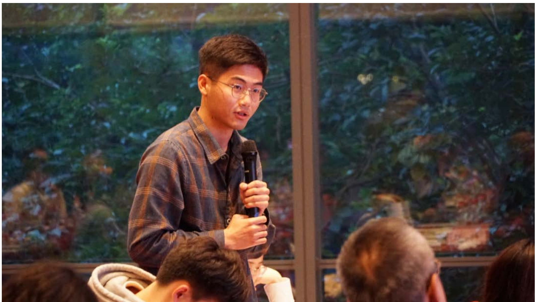
与会学生向专家提问

本次研讨会的活动现场学术氛围浓厚，报告脉络清晰、内容新颖。在提问环节上，参会人员更是针对自己感兴趣的内容踊跃提问及发表个人见解，专家们则耐心地一一解答，极大地拓展了师生们的眼界和科研思路。