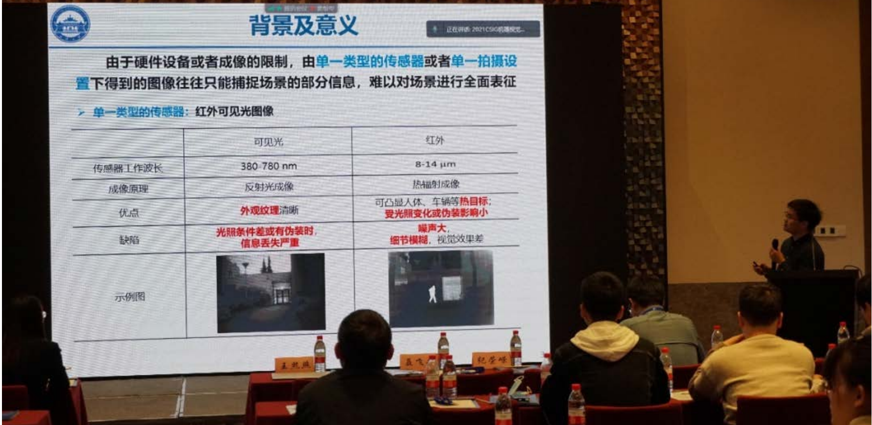
马佳义教授作报告

IAPR/IEEE Fellow、国家杰青、中国图象图形学学会机器视觉专委会主任，北京大学林宙辰教授以“On Training Implicit Models”为题，介绍了隐式模型的相关概念，并对隐式模型提出了一种新的梯度估计，该方法大大加快了训练隐式模型的反向传播速度，且能够在实验性能上获得较大提升。