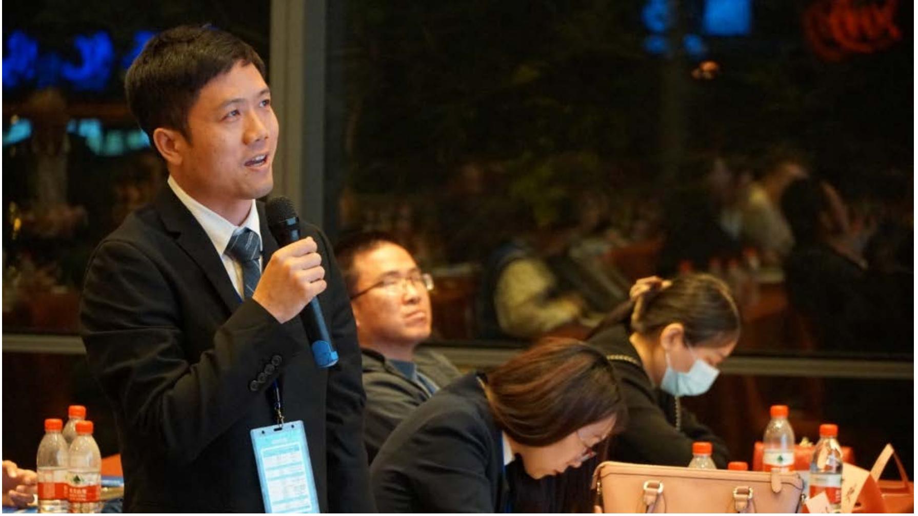
与会老师向专家提问

至此，“2021CSIG机器视觉与智能研讨会”取得圆满成功。感谢福州大学的各级领导、以及Valse组委会对本次会议的高度重视和大力支持！