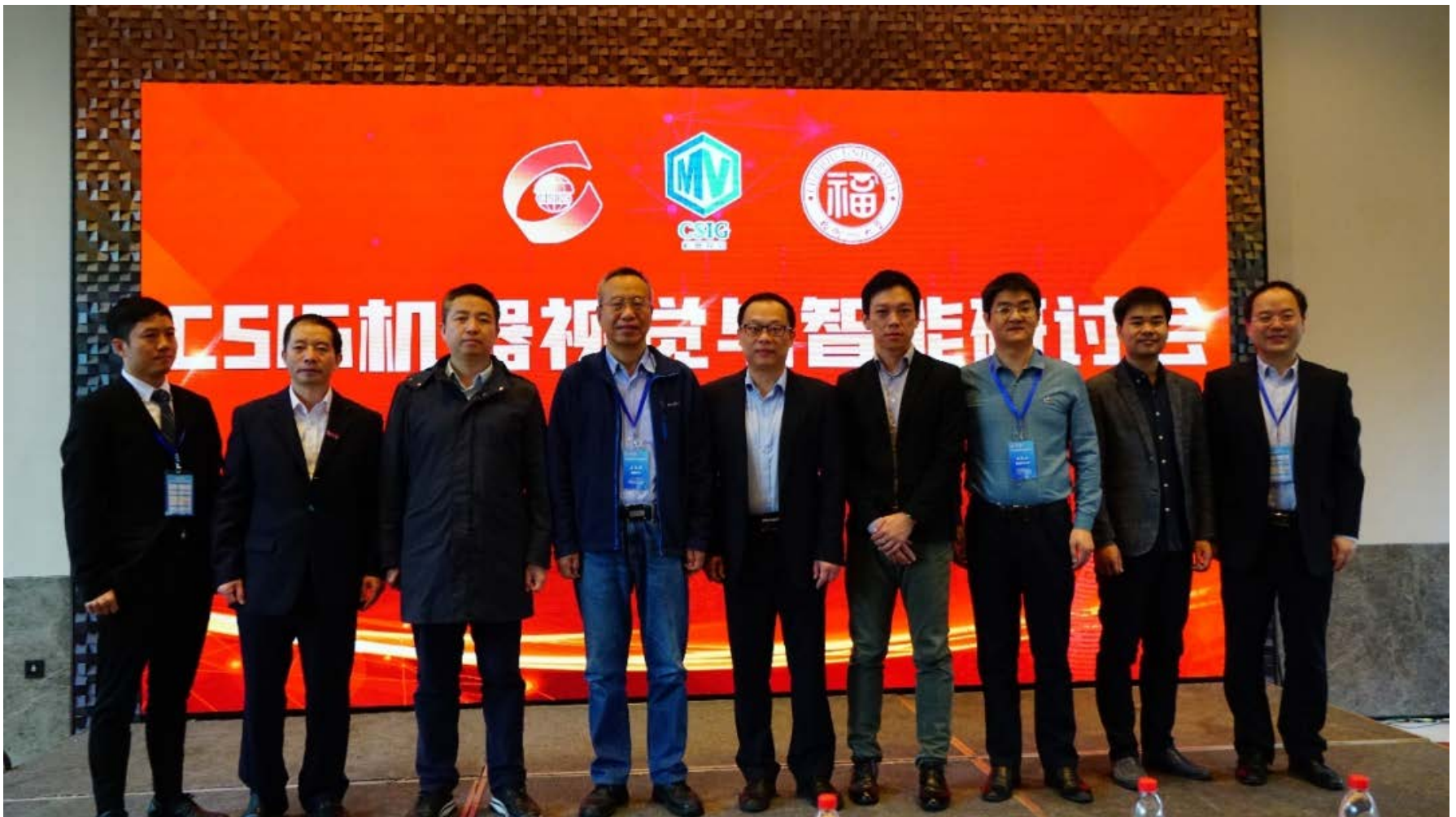
线下参会领导老师合照

至此，“2021CSIG机器视觉与智能研讨会”取得圆满成功。感谢福州大学的各级领导、以及Valse组委会对本次会议的高度重视和大力支持！